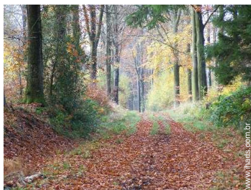
caminho de passeio