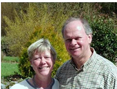
Os seus hóspedes