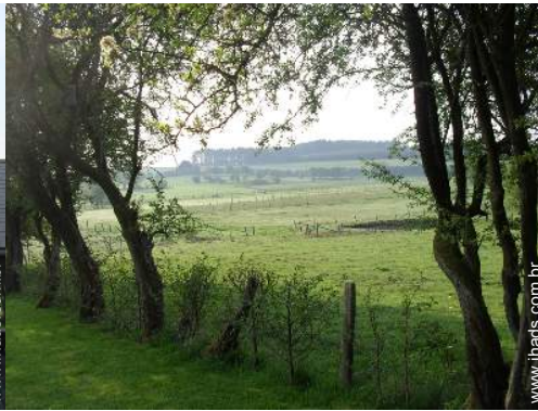
vista para pradaria