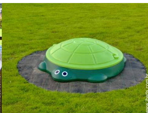
parque infantil com areia