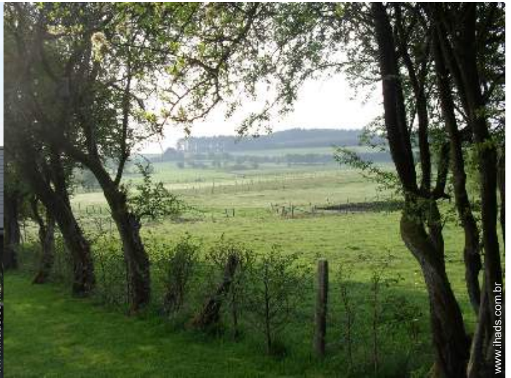
vista para pradaria