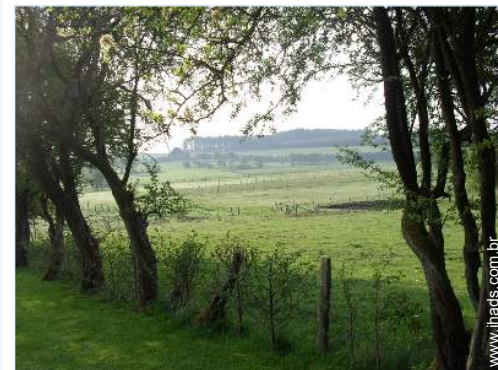
vista para pradaria