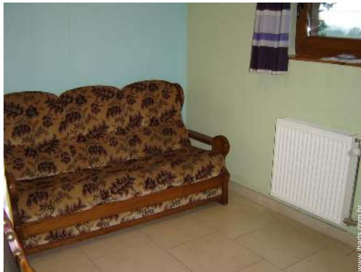
cama(s) convertível/eis dupla(s)