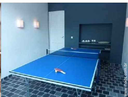
mesa de ping-pong