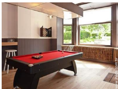
mesa de bilhar