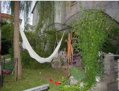
cama de rede