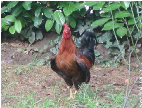
animais da quinta