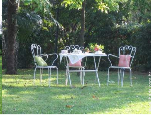
vista para pradaria