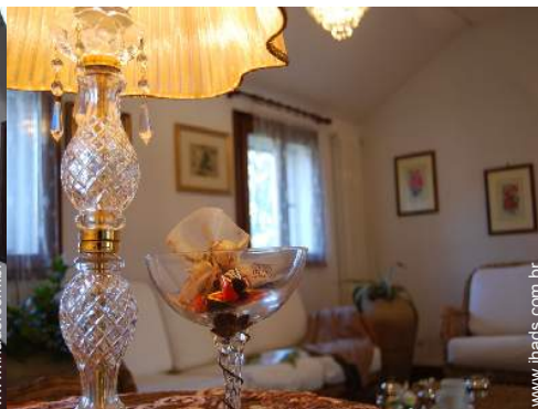
vista a partir do escritório