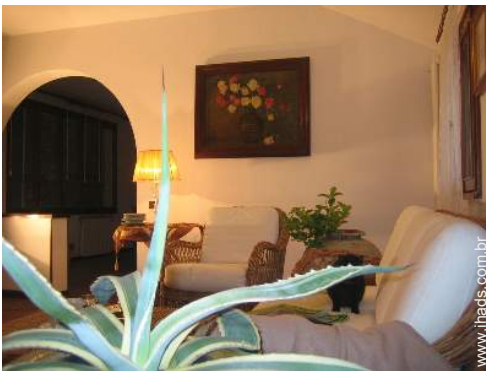
vista a partir do escritório