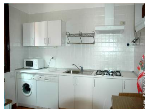
vista a partir da cozinha