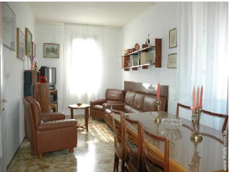
vista a partir da sala de estar