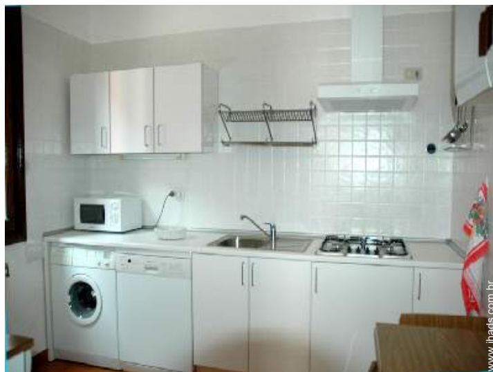
vista a partir da cozinha