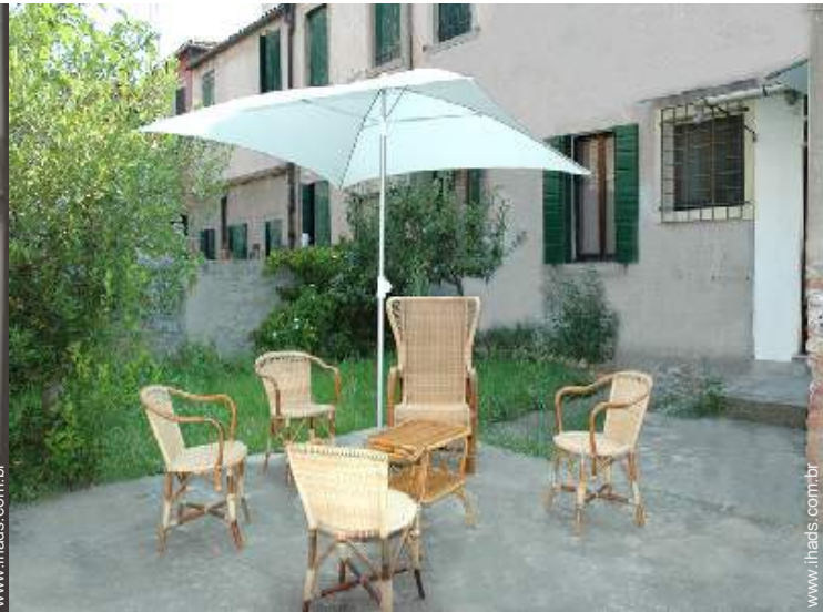
vista de pátio