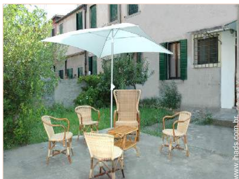
vista de pátio