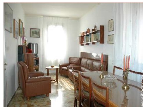
vista a partir da sala de estar

Barbecue, mesa(s) de jardim, 6 cadeira(s) de jardim, carrinho de chá, guarda-sol, 1 espreguiçadeira(s), 2 cadeira(s) de praia