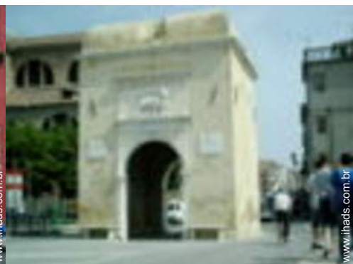
vista para praça