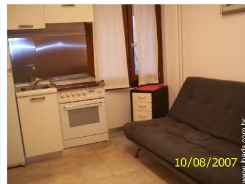
10/08/2007 sofá(s) cama 2 pessoas