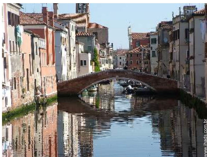
vista de porto