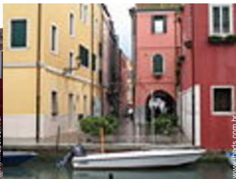
centro da cidade