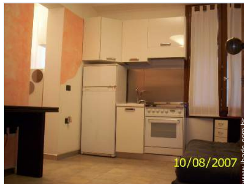
10/08/2007 canto cozinha

Serviço de limpeza, Limpeza de partida, Parque de estacionamento possível como extra (+26R$ *)