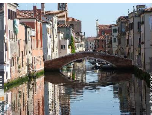
vista de porto