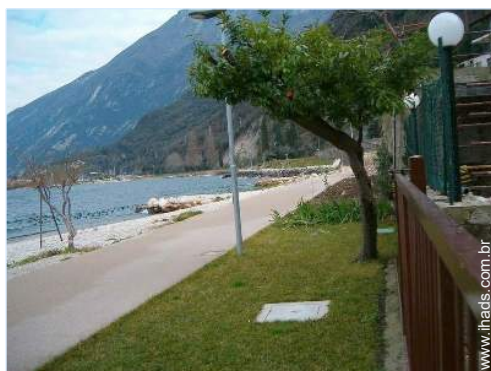
acesso directo à praia