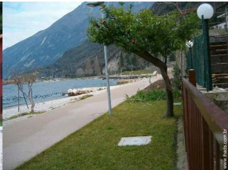
acesso directo à praia