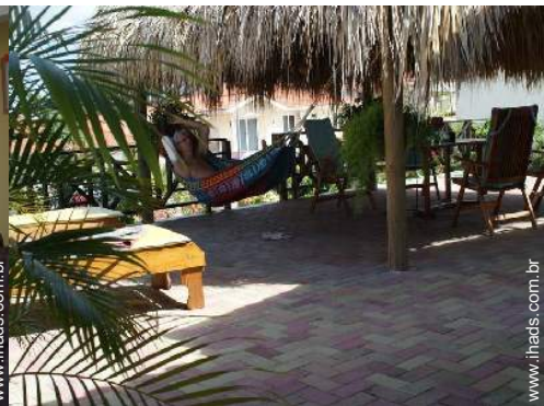
cama de rede