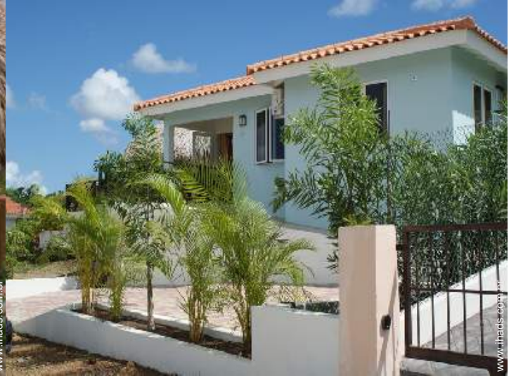
Vivenda de Encanto