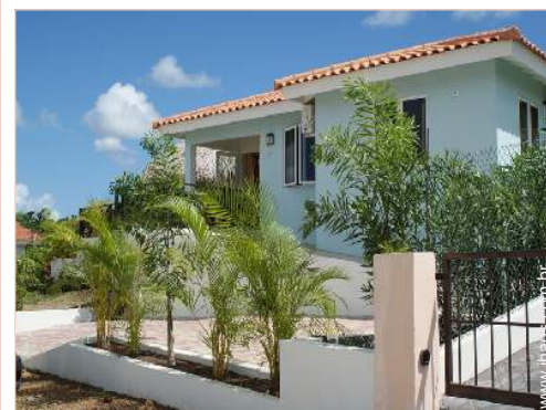
Vivenda de Encanto