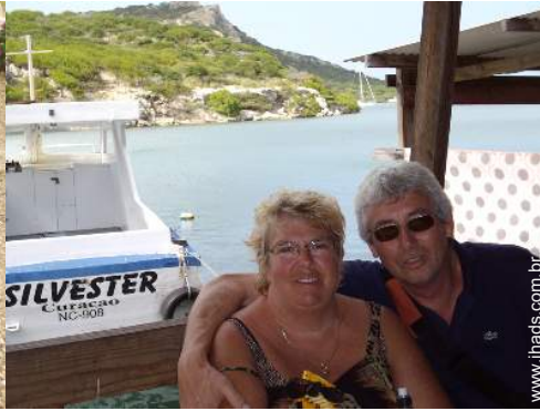
Os seus hóspedes