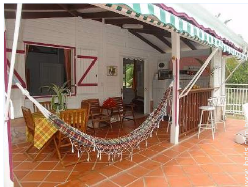
cama de rede