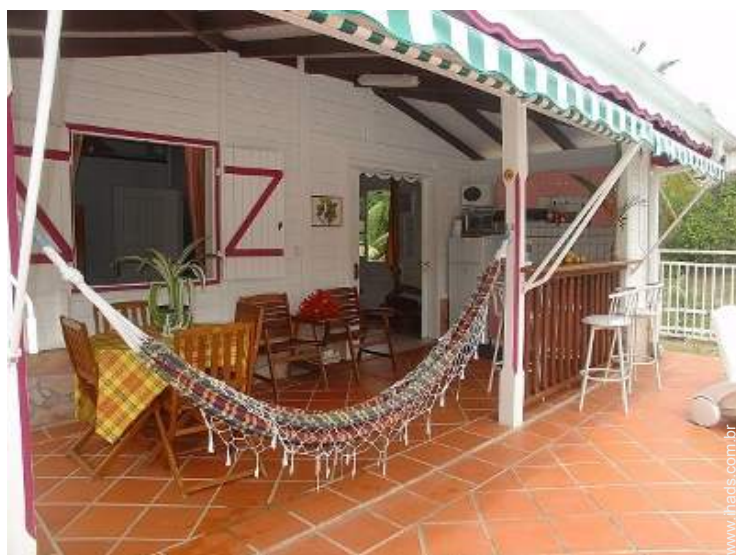
cama de rede