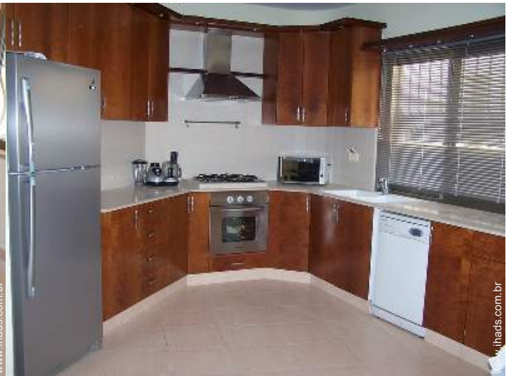
grande cozinha americana