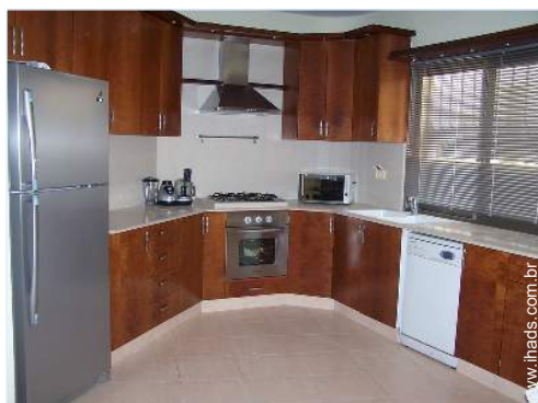
grande cozinha americana

Piscina na residência, rectangular (comprimento 8m, largura 5m), acesso por degraus, acesso por escada (aberta de '01 Janeiro' a '31 Dezembro')