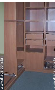
tratamento de roupas