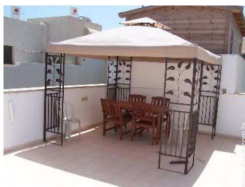
terraço no telhado