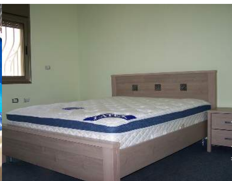
quarto do proprietário