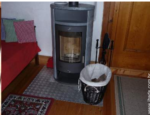
fogão a lenha