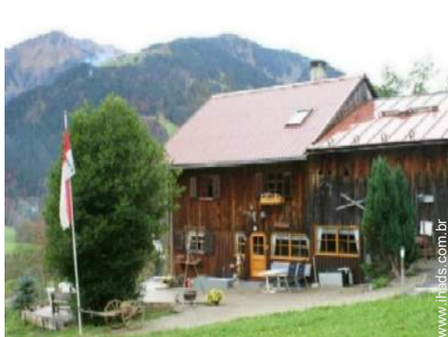
Chalé de Encanto em madeira