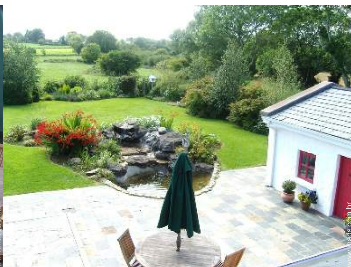
Propriedade de Encanto