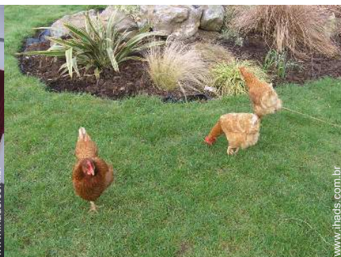
Os animais da casa