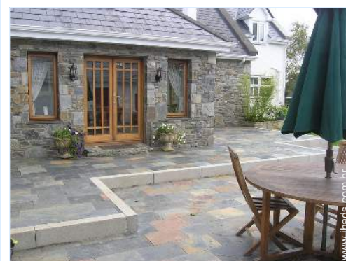
vista a partir do pátio