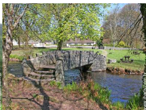
parque e jardim