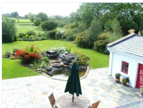
Propriedade de Encanto