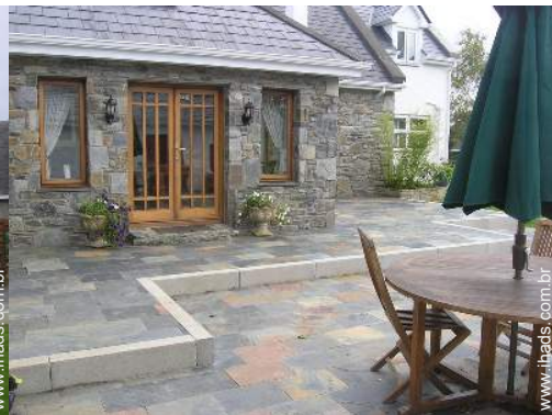
vista a partir do pátio