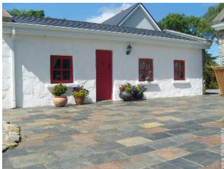
Propriedade de Encanto