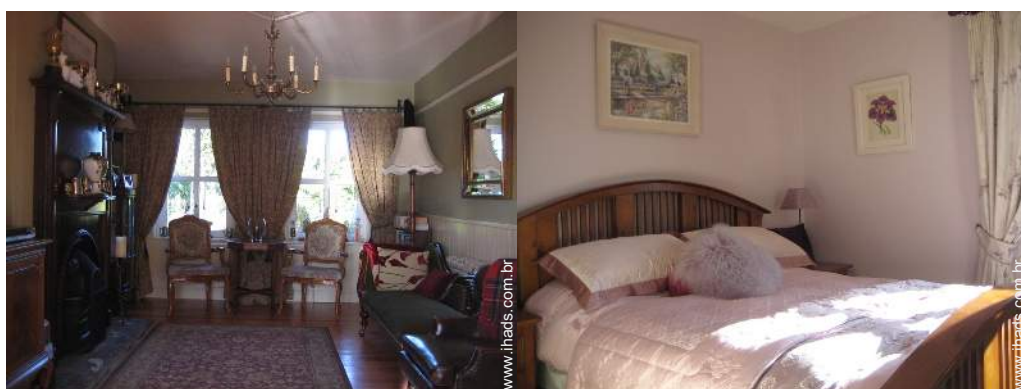
cama(s) de casal