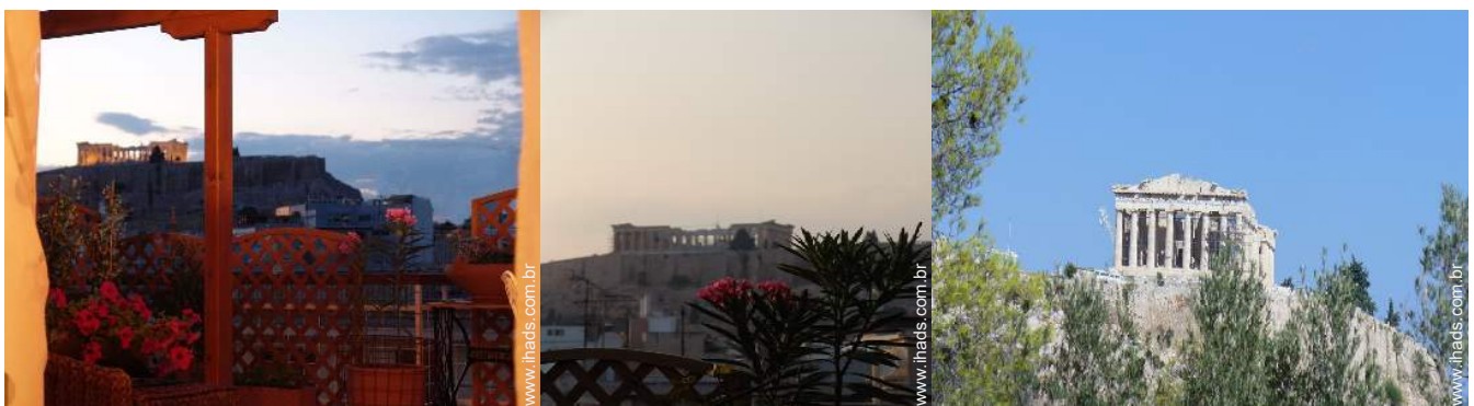
vista sobre monumento